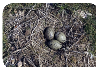
Mewa śmieszka – jaja ( Chroicocephalus ridibundus )