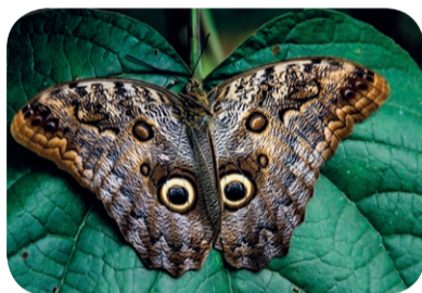
Motyl z oczami sowy ( Caligo memno )