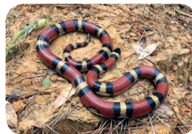
Lancetogłów mleczny ( Lampropeltis triangulum )