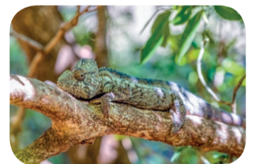
Kameleon Oustaleta ( Furcifer oustaleti )