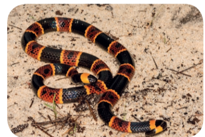
Koralówka arlekin ( Micrurus fulvius )