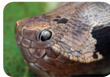
Motyl z rodz. rusałkowatych – gąsienica ( Dynastor darius )