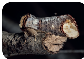
Naróżnica zbrojówka ( Phalera bucephala )

Patyczak przedstawiciel rzędu straszyków – Phasmatodea , którego oskórek do złudzenia przypomina spękaną korę, a długie ciało i głowa pokryte są fałszywymi pączkami i bliznami po opadłych liściach. Cel mimetyzmu: pozostanie niezauważonym w ciągu dnia.