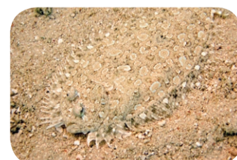
Flądra lamparcia ( Bothus Pantherinus )