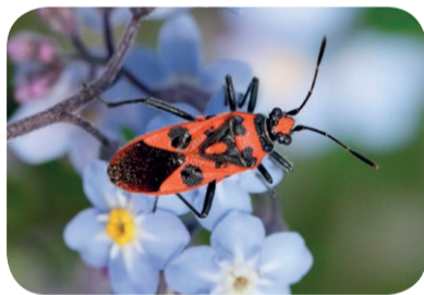
Glinik lulkarz ( Corizus hyoscyami )