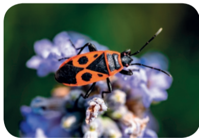
Kowal bezskrzydły ( Pyrrhocoris apterus )