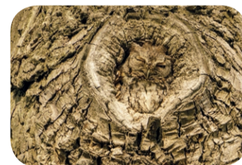
Puszczyk zwyczajny ( Strix aluco )