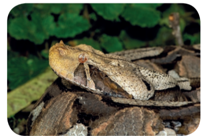
Żmija gabońska ( Bitis gabonica )

Maskowanie, będące upodobnieniem się zwierząt kształtem, barwą i wzorem na powierzchni ciała do otaczającego je środowiska to MIMETYZM , przy czym naśladownictwo barwy podłoża to homochromia, zaś kształtów i deseni – homomorfia.