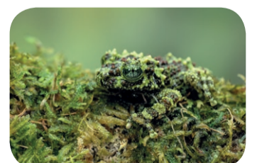
Żaba mszysta ( Theloderma corticale )

ZADANIE DOFINANSOWANE Z BUDŻETU PAŃSTWA ZE ŚRODKÓW MINISTRA EDUKACJI W RAMACH PROGRAMU „ODKRYWCY”