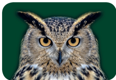
Puchacz wirginijski ( Bubo virginianus )